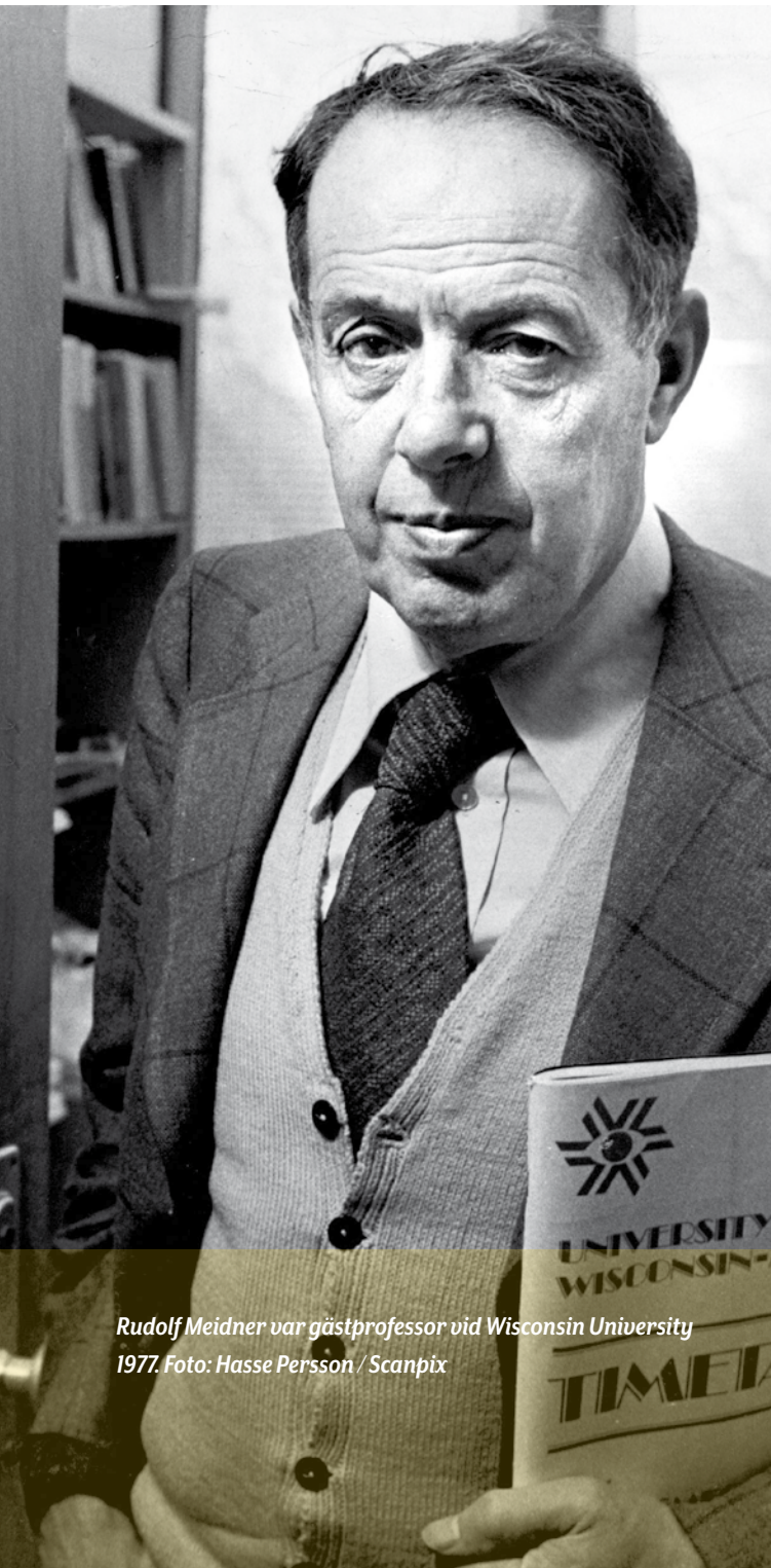
Rudolf Meidner var gästprofessor vid Wisconsin University 1977.

de företag till mer dynamiska, spontant eller med hjälp av en aktiv arbetsmarknadspolitik. Därigenom skulle konkurrenskraften stärkas samtidigt som löntagarkollektivet kontinuerligt lyftes till högre kompetens och allt högre lön. Men en bieffekt blev att de lönsamma företagen erhöll vad som i debatten kallades "övervinster" – vilket stack i ögonen och gick tidsandan emot.