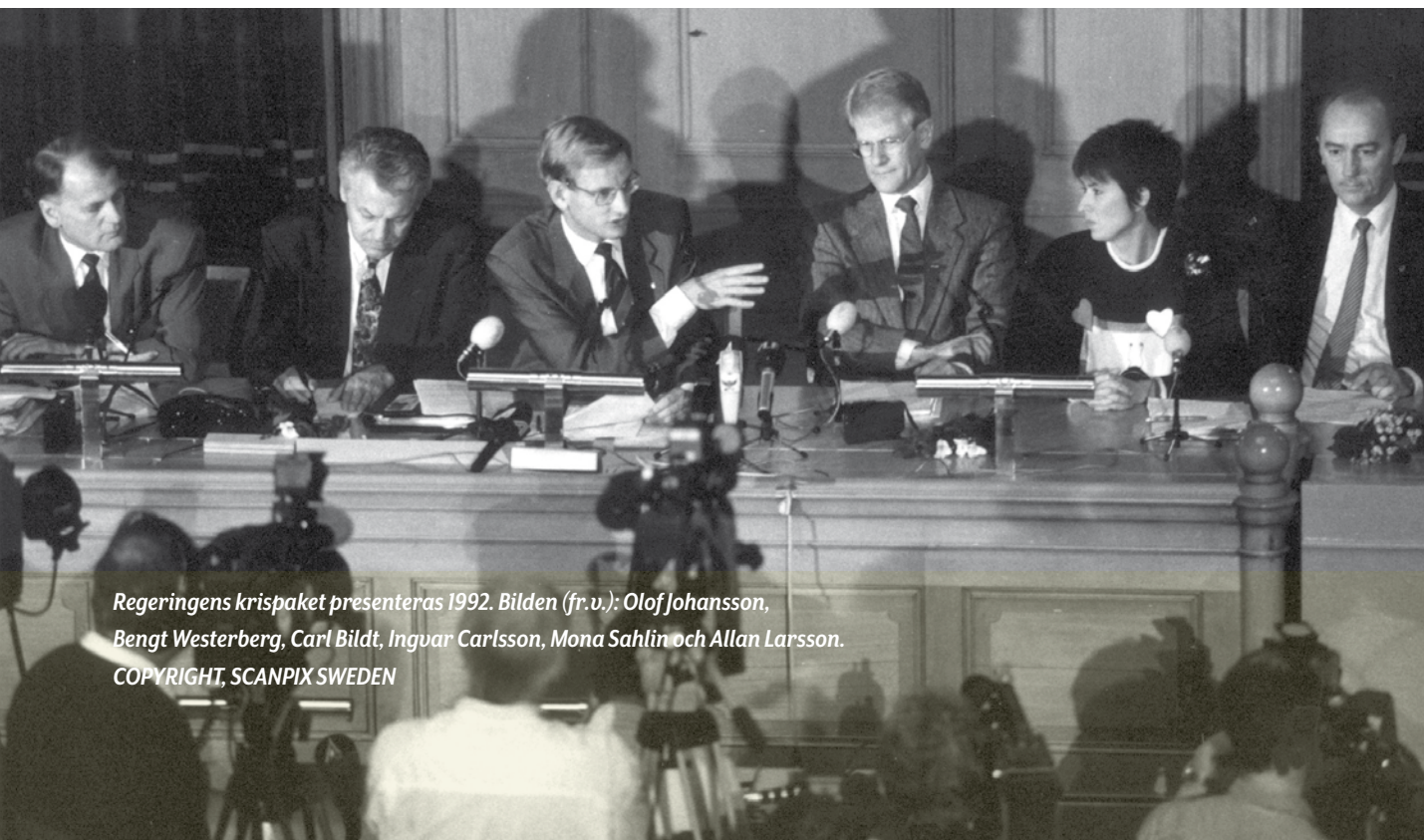
Regeringens krispaket presenteras 1992. Bilden (fr.v.): Olof Johansson, Bengt Westerberg, Carl Bildt, Inguar Carlsson, Mona Sahlin och Allan Larsson.

I ett första skede, vid årsskiftet 1993/94, fördes 10 miljarder över dels till de existerande institutionerna Chalmers, Högskolan i Jönköping och Riksbankens Jubileumsfond (för kulturvetenskaplig forskning), dels till några nybildade forskningsstiftelser: Mistra (Stiftelsen för miljöstrategisk forskning), Östersjöstiftelsen (Stiftelsen för forskning inom områden med anknytning till Östersjöregionen och Östeuropa) och SSF (Stiftelsen för strategisk forskning). Därefter – när man trodde utminuterungen av miljarderna var avslutad – dök ett oväntat men på sitt sätt